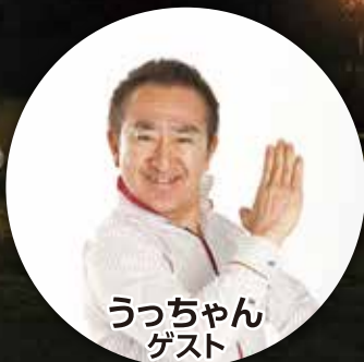
うっちゃん ゲスト

★女性の集合場所は青森港/佐井村現地集合から選択。青森集合の方は、集合場所からスタッフが同行いたします。 ※1泊2日・3食付き ※感染予防対策のため原則1室1名利用 ※新型コロナウイルス感染症の予防を心がけながら実施します。 ※天候、新型感染症拡大の影響により予告なく急遽内容を変更する場合があります。 ※新型感染症拡大の状況によってイベントを中止する場合があります。